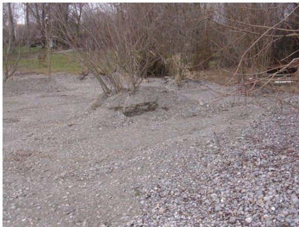
Abgeschobener Strandwall am Surferufer im Freibad Hagnau

Eigentlich wäre das Surferufer innerhalb des Hagnauer Freibades ideal aus Kiesfang, d.h. als Entnahmestelle des verfrachteten feineren Kiesel. Stattdessen wurden vor 2 Jahren (nach dem Hochwasser 2013) die großen Mengen des hier angelandeten Kiesel wieder in die Wasserwechselzone geschoben (s. Fotos)! Dieser leicht verfrachtbare Kies wird in Bälde die angelandeten Kiesflächen am Westende des Kirchberger Campingplatzes und in den dortigen Uferbiotopen weiter vergrößern.