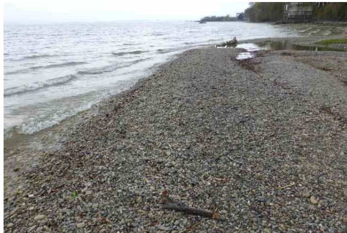
Kies, den der Mühlbach in den See geschwemmt hat und den der Wellenschlag wieder anlandet (April 2015)

Dieses jahreszeitliche Wechselspiel wird sich an der Mühlbachmündung wahrscheinlich solange fortsetzen, bis die beträchtlichen Kiesmengen an der Mühlbachmündung weit gehend verschwunden sind. Derzeit hat die hier angelandete Kiesmenge ihren Höhepunkt noch nicht überschritten.