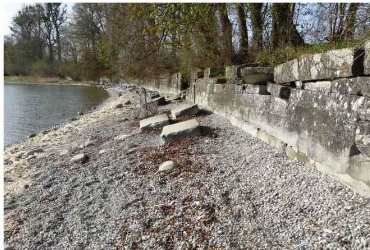
Heutiger Zustand der Kiesvorfüllung.

Der Mauerfuß ist in der Kirchberger Bucht weiterhin ausreichend gesichert durch die verbliebenen Reste. Im Nachhinein muss man feststellen, dass man den Mauerfuß mit einem Bruchteil des eingebrachten Materials genauso wirkungsvoll hätte sichern können.