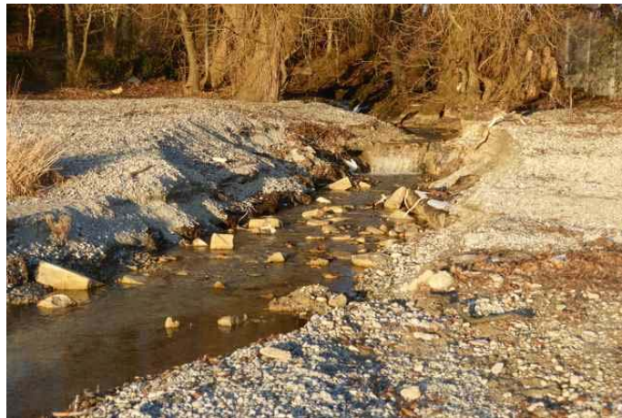
Durchbruch des Mühlbachs (Februar 2015) Die dunkelbraune Schicht (ganz unten) war die frühere Uferhöhe.

Erst im Laufe der jeweiligen Winter gelingt es dem Mühlbach, den Kieswall wieder zu durchbrechen. Die Kiesmengen, die er dabei in den See spült, werden umgehend durch Wind und Wellenschlag (auch der Wellenschlag der Katamarane spielt hier mit) wieder angelandet und bilden im Winter und Frühjahr einen langen flachen Kieswall längs des Spülsaums – Kiesmengen, die mit steigendem Wasserstand und beim nächsten Starkwind aus W oder SW nach Osten verfrachtet werden! Derzeit (April 2015) lagern am Spülsaum an der Mühlbachmündung rund 20 cbm Rollkies!