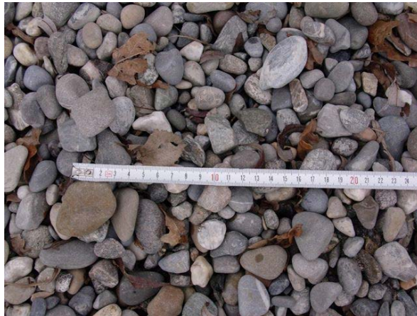
Korngröße des angelandeten Kiesel

Eigentlich wäre das Surferufer innerhalb des Hagnauer Freibades ideal aus Kiesfang, d.h. als Entnahmestelle des verfrachteten feineren Kiesel. Stattdessen wurden vor 2 Jahren (nach dem Hochwasser 2013) die großen Mengen des hier angelandeten Kiesel wieder in die Wasserwechselzone geschoben (s. Fotos)! Dieser leicht verfrachtbare Kies wird in Bälde die angelandeten Kiesflächen am Westende des Kirchberger Campingplatzes und in den dortigen Uferbiotopen weiter vergrößern.