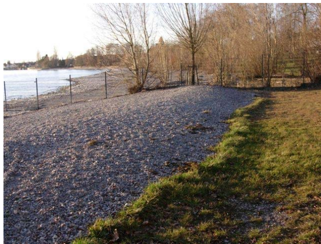
Mittlerweile deutlich größer geworden: angelandeter Kies am westlichen Ende des Kirchberger Campingplatzes (Februar 2014)