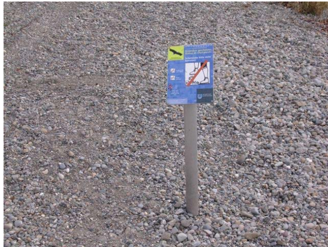
Verfrachteter Rollkies östlich des Freibad Hagnau und ein wenig sinnvolles gewordenes Hinweisschild (2014)

Im Freibad Hagnau wurde die lange Ufertreppe beseitigt und das Ufer renaturiert. Dabei kam ein Gemisch aus verschiedenen Kiesgrößen zum Einsatz. Wie zu erwarten war, wurde die feinere Kiesfraktion sehr bald nach Osten verfrachtet. Im flacheren Ostteil des Freibads, dort wo die Surfer ihr Abteil haben, wurden große Mengen des verfrachteten feineren Kieses angespült, und auch jenseits des Ostzaunes, am westlichen Campingplatzufer, schwoilen die Kiesmengen stetig an. Die Kiesflächen reichen mittlerweile bis in die angrenzenden Uferbiotope hinein.